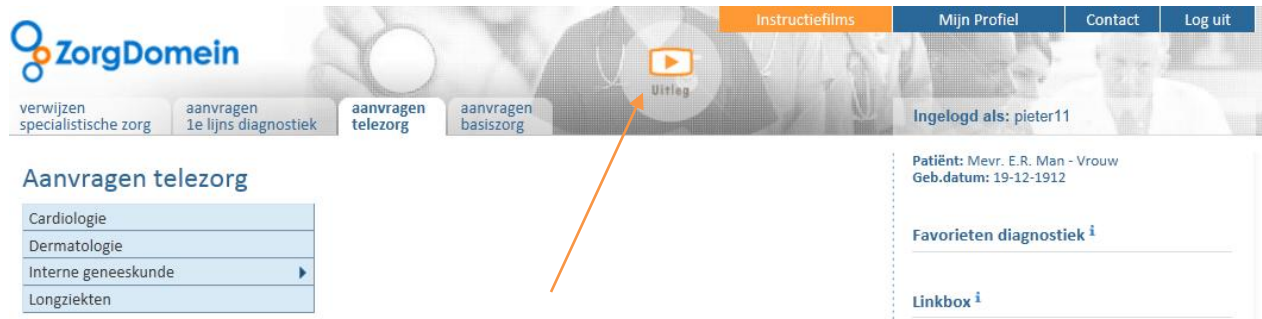
Figuur 4: Klik op de knop voor een korte uitleg over ZorgDomein in zijn geheel