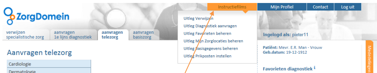
Figuur 5: Onder het oranje menu-item 'Instructiefilms' zijn films aan te klikken waarbij apart wordt ingegaan op verschillende onderdelen van ZorgDomein