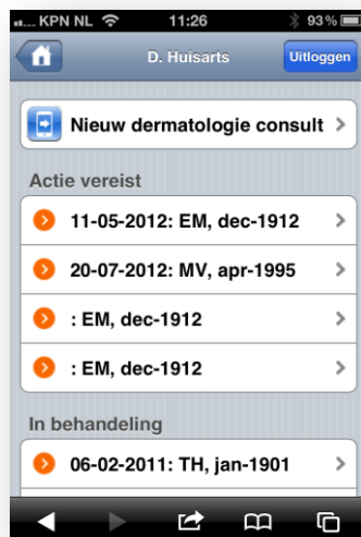
Figuur 3: iPhone statusoverzicht en aanvraag mogelijkheid

Met de introductie van de nieuwe telezorg functionaliteit is het mogelijk geworden de status van alle verschillende typen telezorg aanvragen te volgen op uw iPhone of iPad. Het is tevens mogelijk een teleconsult dermatologie aan te vragen vanaf uw iPhone of iPad, zie figuur 3. Toegang tot telezorg via iPhone of iPad vraagt u aan bij de Servicedesk van ZorgDomein via: tel. 020-4715282 of e-mail servicedesk@zorgdomein.nl .